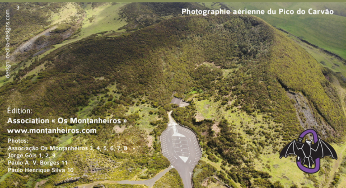
3 Photographie aérienne du Pico do Carvão

Toute activité humaine, que ça soit économique, scientifique ou de loisir, requiert des comportements et des attitudes qui assurent le plein respect pour le lieu.