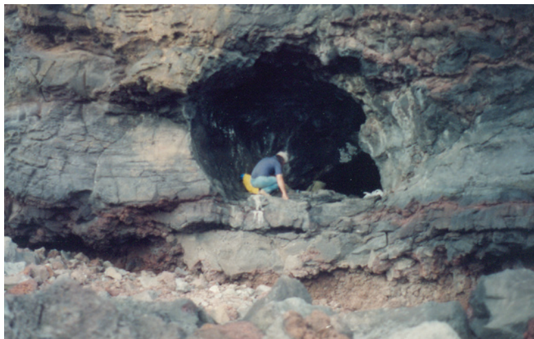
Entrada da Gruta de Água de Pau junto ao mar, Lagoa, São Miguel, Açores.