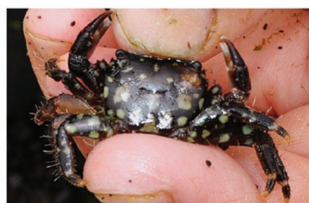
FIGURA 1 Pachygrapsus marmoratus e Pachygrapsus maurus .