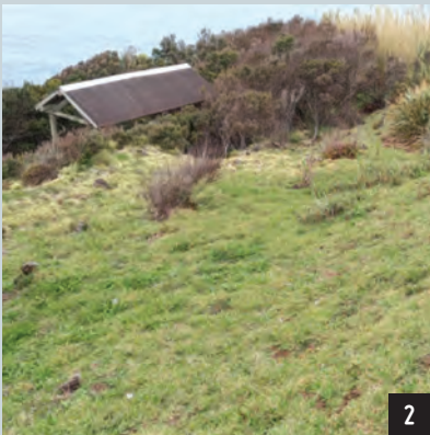
FIGURA 8 1 - Fotografia da vegetação dos 50 m de altitude em 2013; 2 - Fotografia da vegetação dos 50 m de altitude em 2025.