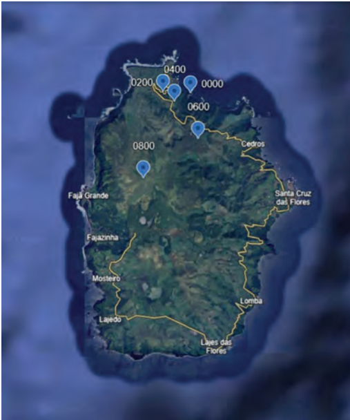
FIGURA 1 Mapa com as cinco altitudes amostradas na ilha das Flores em 2025 (Google Earth).

A 60 metros de altitude, a comunidade vegetal corresponde a um bosque costeiro com uma altura de 8 m, dominado por Pau-branco, Faia-da-terra e Incenso, e apresentando uma cobertura de briófitos concentrada sobretudo nos troncos arbóreos. Aos 200 metros, observa-se já um núcleo de floresta com 7 m de altura onde dominam Urze, Incenso, Faia-da-terra, Uva-da-serra, e Feto-do-botão, destacando-se a maior incidência de briófitos nas superfícies rochosas. No patamar intermédio (400 m de altitude) encontramos uma floresta com um porte de 6 m e dominada por pau-branco, louro-da-terra e incenso, com a presença de outras espécies como a invasora conteira e o feto endémico Driopteris dos Açores. Os briófitos distribuem-se principalmente pelo solo e pelos troncos. A 600 metros, a formação florestal atinge cerca de 3 m de altura e é dominada por cedro-do-mato, feto-do-cabelinho, Uva-da-serra e azevinho. Nesta faixa altitudinal, a cobertura de briófitos é expressiva tanto no solo