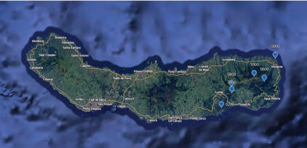
FIGURA 7 Mapa com as seis altitudes amostradas na ilha de São Miguel em 2025.