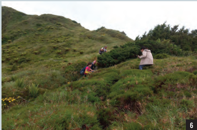
FIGURA 9 Vegetação nos diversos gradientes altitudinais na ilha de São Miguel, em 2025. 1 – 50 m; 2 – 200 m; 3 – 400 m; 4 – 600 m; 5 – 800 m; 6 – 1000 m.