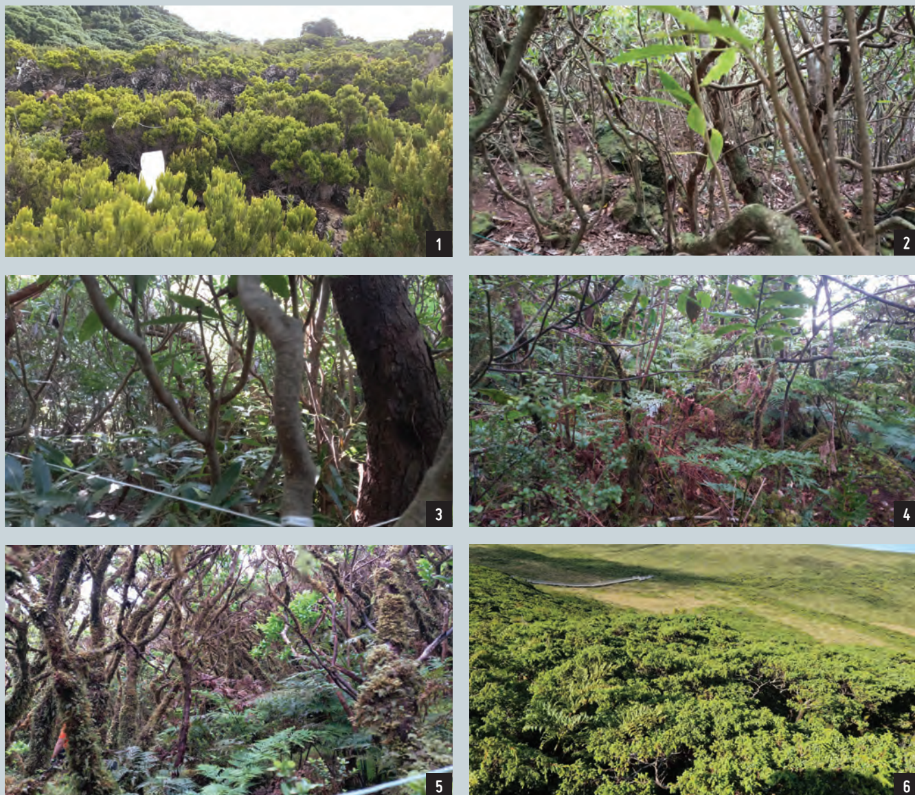
FIGURA 6 Vegetação nos diversos gradientes altitudinais na ilha Terceira, em 2024. 1 – 10 m; 2 – 200 m; 3 – 400 m; 4 – 600 m; 5 – 800 m; 6 – 1000 m.

Na ilha de São Miguel, o trabalho de campo foi realizado do dia 19 ao dia 26 de julho de 2025, pelos autores: MAS, LNM, RA, RBE e RG. Nesta ilha foram amostrados seis níveis altitudinais (50-1000 m), todos na zona Este da ilha (Figura 7).