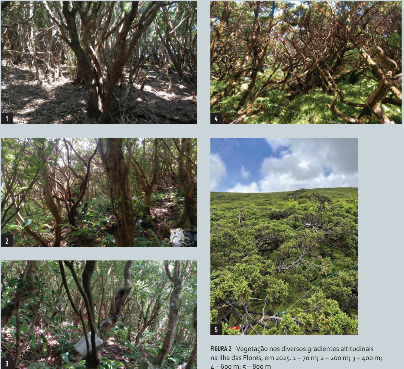
FIGURA 2 Vegetação nos diversos gradientes altitudinais na ilha das Flores, em 2025. 1 – 70 m; 2 – 200 m; 3 – 400 m; 4 – 600 m; 5 – 800 m

como nas árvores. Finalmente, a 800 metros, no Morro Alto, área classificada como reserva natural, predomina uma vegetação de baixo porte (50 cm de altura) composta por Cedro-do-mato, Uva-da-serra, Feto-pente e a juncácea Saragasso. O solo encontra-se densamente coberto por briófitos, com particular destaque para espécies de Musgão.