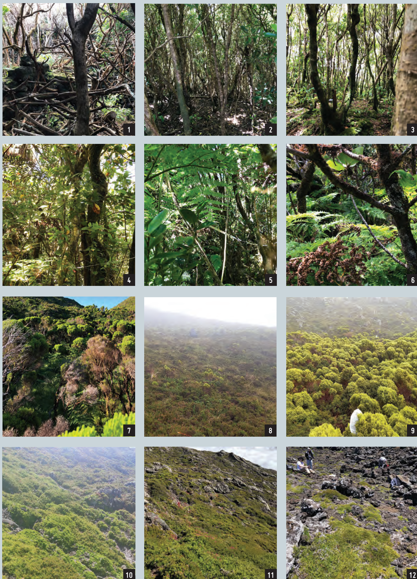
FIGURA 4 Vegetação nos diversos gradientes altitudinais na ilha do Pico, em 2024. 1 – 10 m; 2 – 200 m; 3 – 400 m; 4 – 600 m; 5 – 800 m; 6 – 1000 m; 7 – 1200m; 8 – 1400 m; 9 – 1600 m; 10 – 1800 m; 11 – 2000 m; 12 – 2200 m.