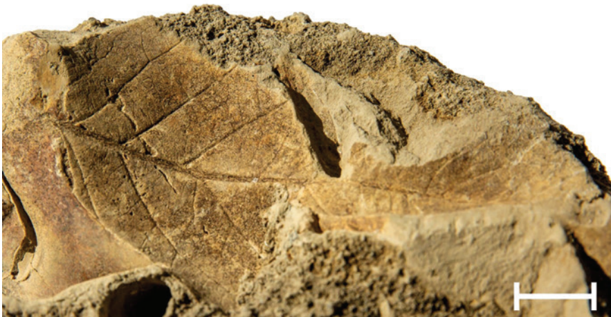
Fig. 2. – Cuniculonomus isp., mina ofionoma em ? Laurus azorica , MV-AdH_190.

No entanto, os estudos sobre fitófagos açorianos e sua especialização alimentar também são escassos e apontam para baixos níveis de especialização (Ribeiro et al., 2005; Rego et al. 2019). Os insectos fitófagos mais especializados estão associados a Erica azorica , Laurus azorica e Ilex azorica . As lagartas das espécies endémicas Ascotis fortunata azorica e Cyclophora azorensis são