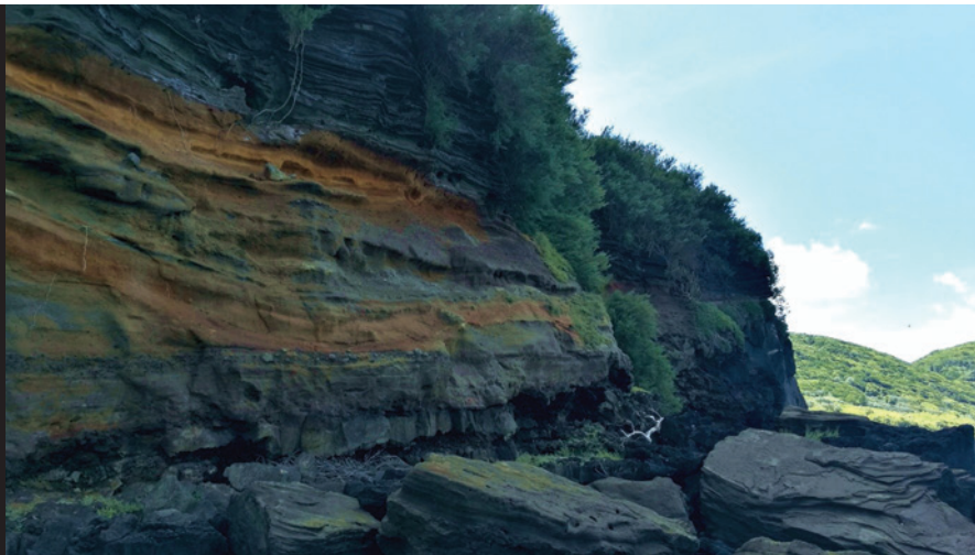
Fig. 1. Falésias na Baía do Fanal perto de Angra do Heroísmo, uma das possíveis localidades da origem da mina Cuniculonomus isp. nas colecções do Museu Vulcanoespeleológico