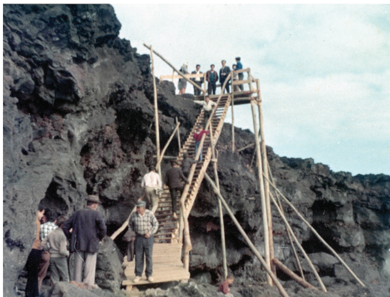
Visita à Gruta das Agulhas nos anos 70 usando a estrutura de madeira construída para o efeito.