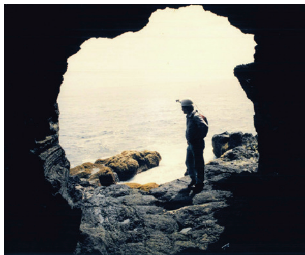
Entrada da Gruta das Agulhas vista do lado de dentro do tubo de lava.