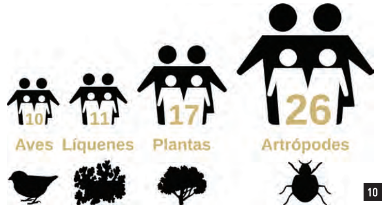
Número total de participações nas sessões das Aves, Líquenes, Plantas e Artrópodes no BioBlitz Açores 2023

Aos participantes do BioBlitz Açores 2023, para que tenham a oportunidade de ficar a conhecer ainda mais espécies que existem nos Açores, foram ainda oferecidas duas publicações recentes de 2022 sobre biodiversidade do arquipélago em que o Grupo da Biodiversidade dos